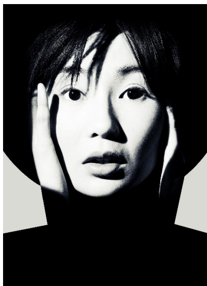
Maggie Cheung, Paris 1998