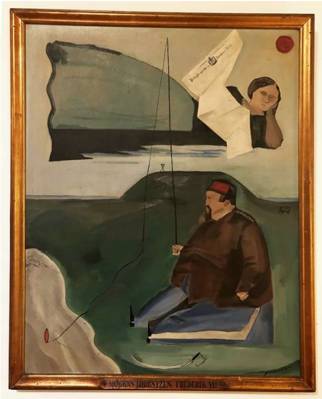
Mogens Lorentzens maleri af Frederik 7. og Grevinde Danner. Udført til Kino-palæet i 1918. Privatfoto.